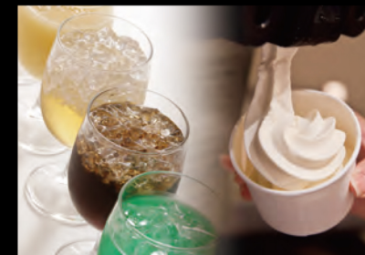
ソフトドリンク・ソフトクリーム