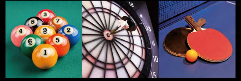
ビリヤード・ダーツ・卓球