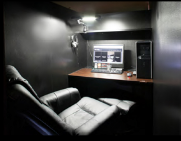
リクライニングシート