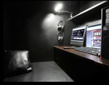
ペアフラットシート (2名)