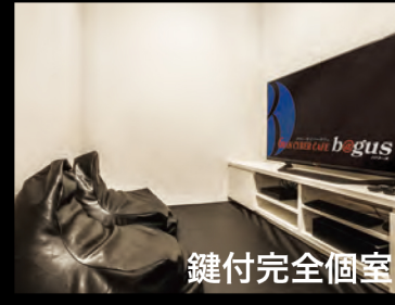
シアタールーム (2~5名)