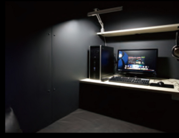
フラットシート (1~2名)