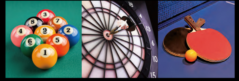
ビリヤード・ダーツ・卓球