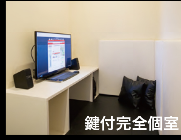
プライベートルーム (1~2名)