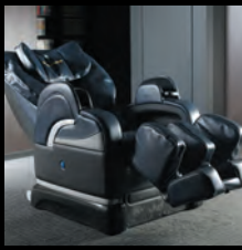
マッサージシート