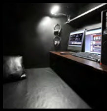
ペアフラットシート