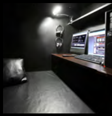
ペアフラットシート